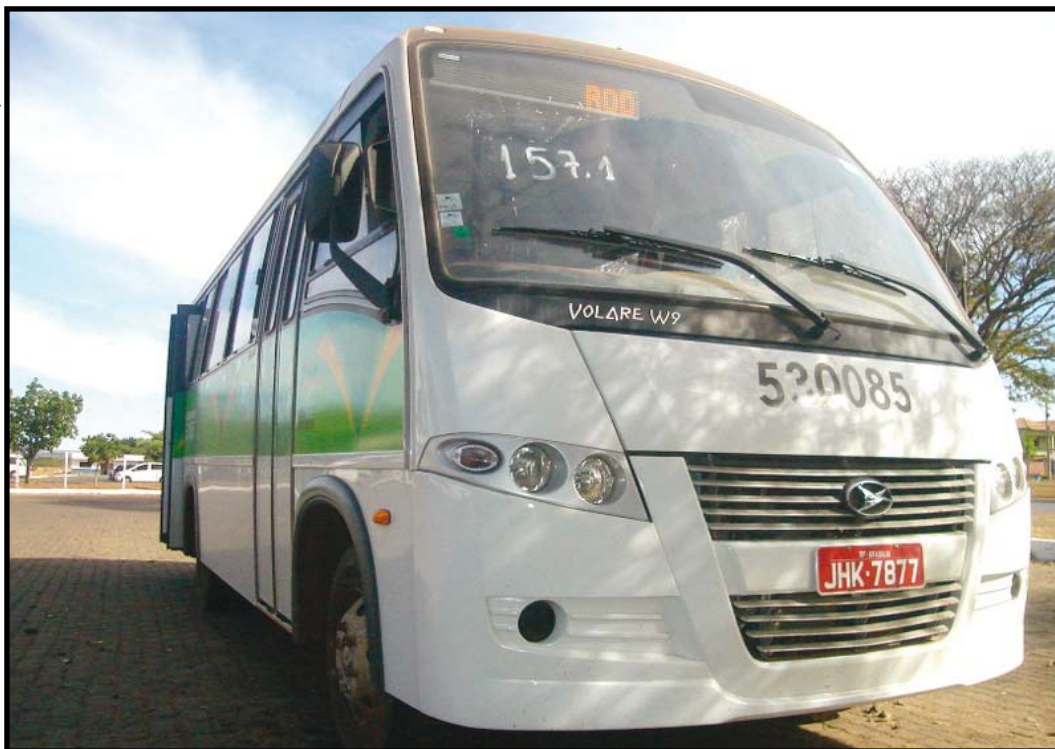
Linha 157.1: do Guará II até a Rodoferroviária, itinerário cumprido, situação rara entre os 350 novos microônibus

Há promessas de entrarem em circulação mais cem novos microônibus, que estão em fase de liberação, totalizando 450 novos veículos. Espera-se que assim, os novos microônibus superem os velhos problemas