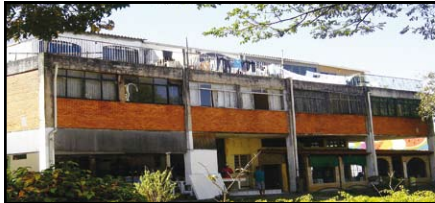
Na 404 Norte, construção compromete estrutura do prédio, que pode até cair

Há 12 anos, os proprietários de quatro quitinetes da comercial construíram um segundo andar no telhado. O que era um imóvel de dois quartos, sala, cozinha e banheiro hoje possui o dobro do espaço. “Existe apartamento ali que chega a ter quatro quartos, duas salas, tudo no andar de cima. Os proprietários cobram o dobro do aluguel para os inquilinos, porque o apartamento possui o dobro do tamanho”, diz a moradora de um dos quatro puxadinhos, que não quis se identificar por medo de alguma reação dos proprietários do lugar. “Os apartamentos são repúblicas para estudantes, com, no mínimo, seis moradores”, reclama a moradora.