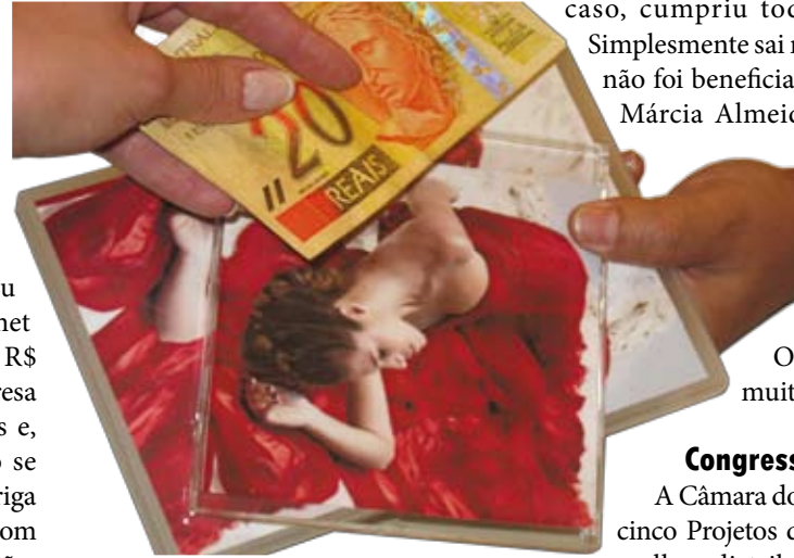
DVD + CD Vanessa da Mata: preço médio 40 reais