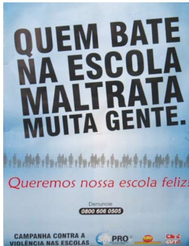
Cartaz da Campanha do Sinpro - DF