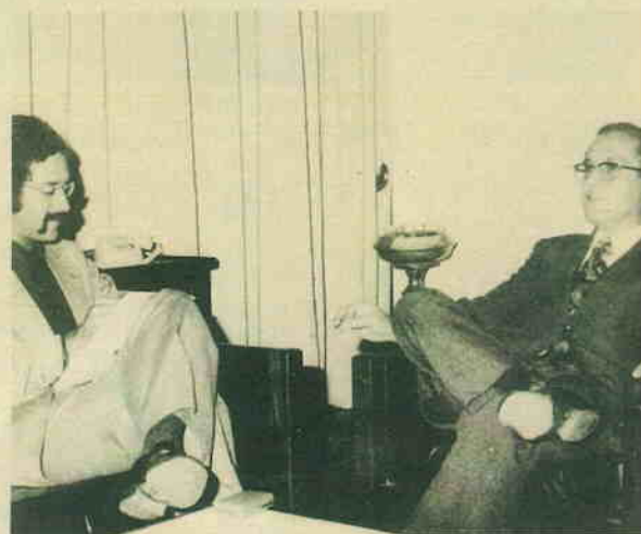
O governador Elmo Serejo e o Editor Geral do "Esquina", quando da entrevista exclusiva.

Norte. Segundo o Governador, "o hospital começou a ser construído com recursos da Fundação Hospitalar da ordem de 5 milhões de cruzeiros, agora estamos, através da Secretaria de Saúde, elaborando convênio com o INPS no sentido de concluir e equipar aquele hospital, bem como o de Santa Paula e o Laboratório Central". O custo total do hospital da Asa Norte será de 70 milhões de cruzeiros, e até ao final do ano passará para administração e execução diretas da Novacap.