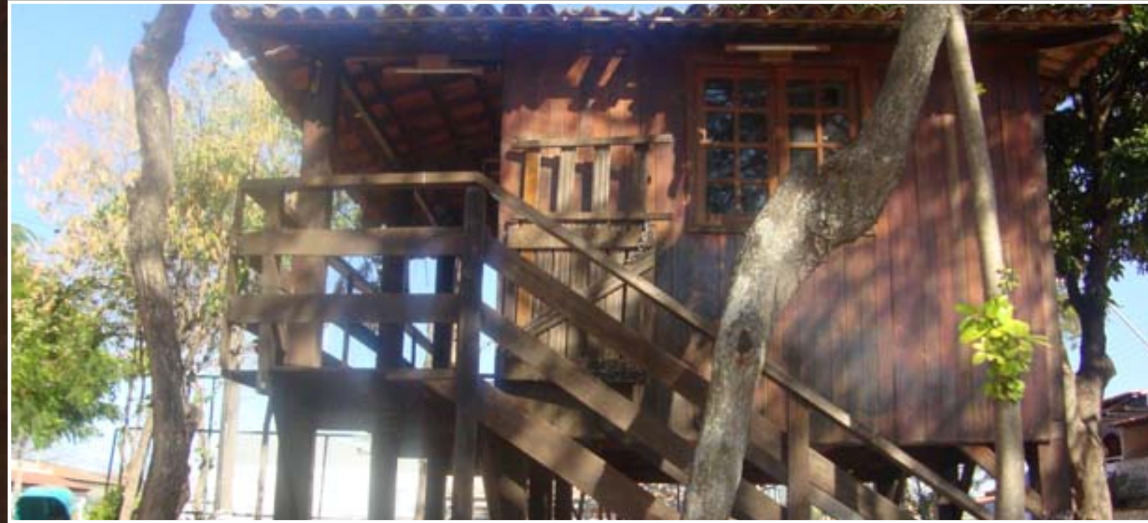
Biblioteca da árvore foi construída há dez anos em Taguatinga