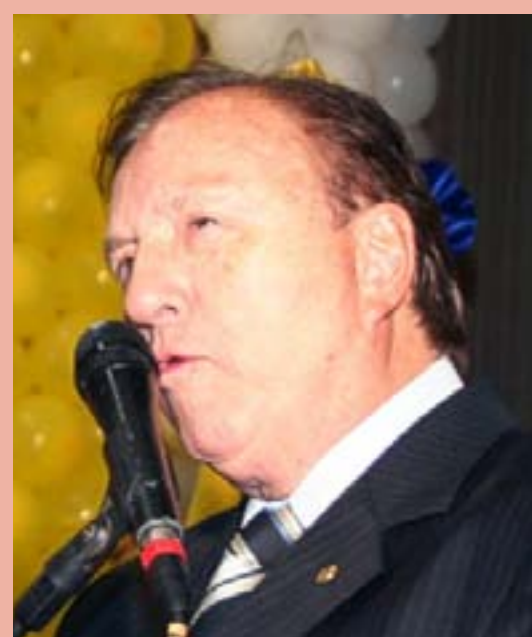
José Maria Eymael