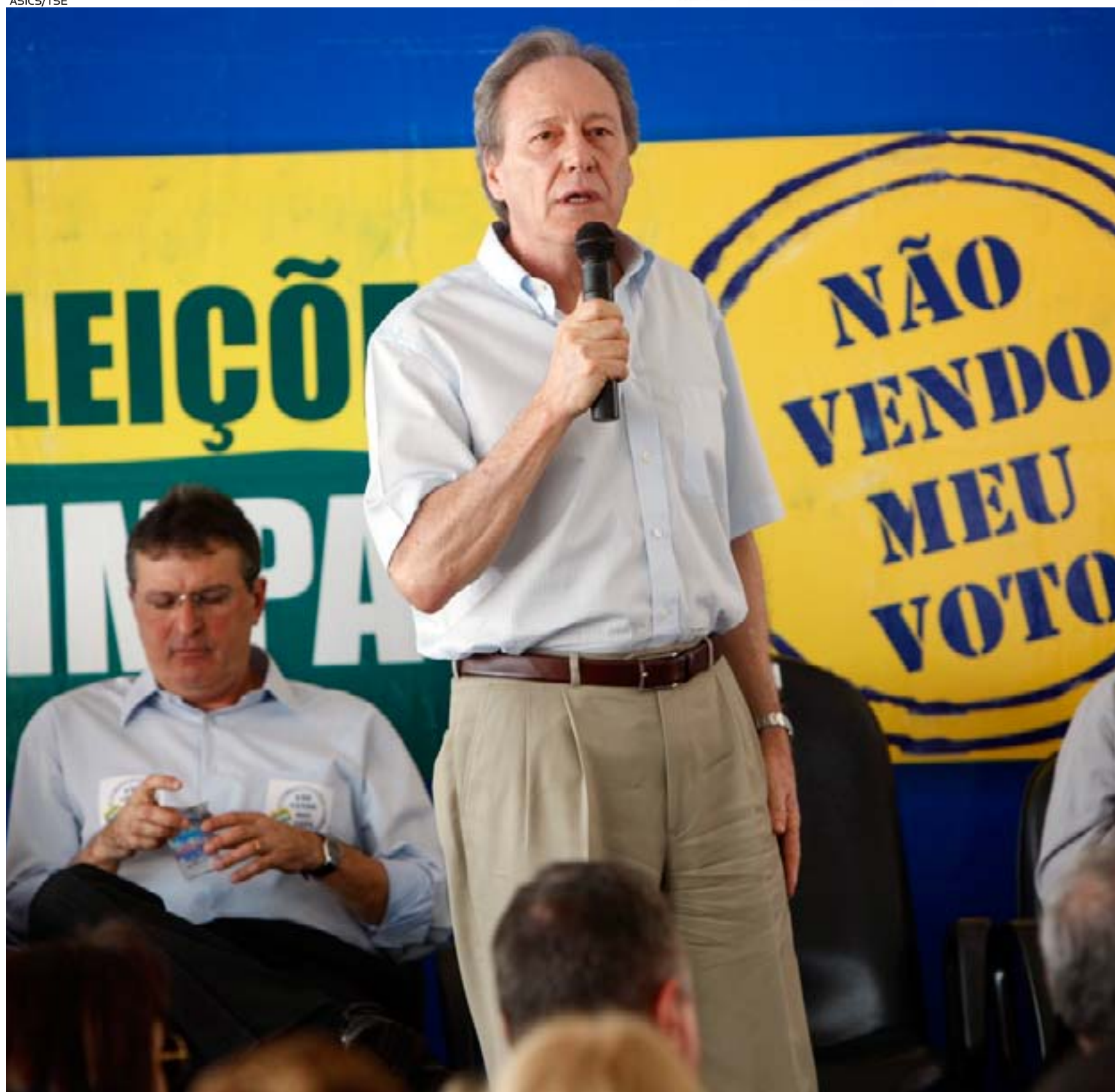
Presidente do TSE, ministro Ricardo Lewandowski (em pé); e presidente da AMB, Mozart Valadares (sentado) no lançamento da cartilha

para acusar um político e fazer a denúncia. Entre os atos de corrupção, são mencionados a compra de votos, o uso da máquina pública e a realização de boca de urna.