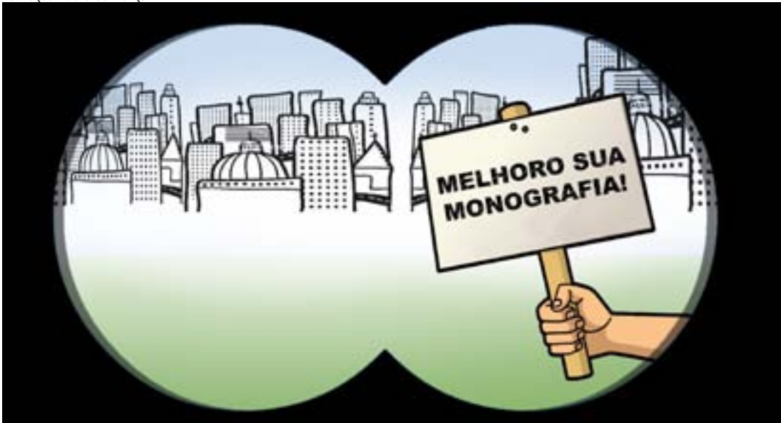
Ilustração: Leonardo França

No momento em que o serviço é solicitado, a maior preocupação dos vendedores de monografias é com o fato de o aluno acompanhar o que seu orientador passa. Eles recomendam que o estudante não fuja das orientações do professor. “Se você apresentar um trabalho pronto, certinho sem orientação, eles vão até colocar seu trabalho