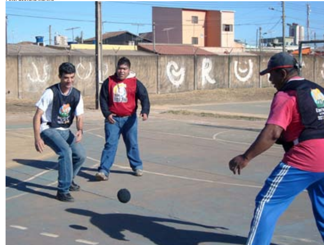
Para a prática do esporte, o que menos interessa é a qualidade da bola. Vitória da intenção