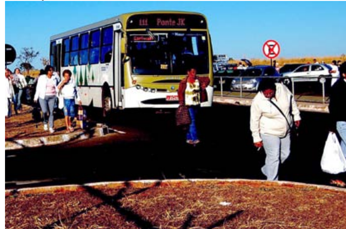
Mulheres chegam para visitar parentes presidiários. Caminhada pela frente é grande