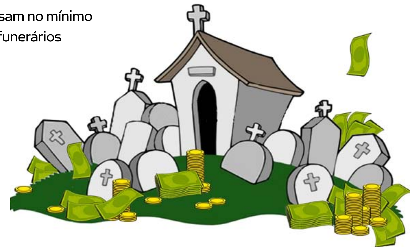
Ilustração: Leonardo Ferraço

Com um leque de serviços extenso, as funerárias têm cada vez mais lucratividade. Os grandes investimentos em serviços diferenciados e inovadores fazem com que o mercado se torne bastante promissor. Prova disso é o crescimento de empresas nesse setor. De acordo com a Associação Brasileira de Empresas e Diretores do Setor Funerário (Abredif), há 5.500 empresas em funcionamento no país. Os serviços são opcionais, porém quase sempre utilizados. Urnas, flores, velas, véus, material de proteção individual, ornamentação e produtos de assepsia do corpo são exemplos do que as empresas oferecem. As funerárias também são