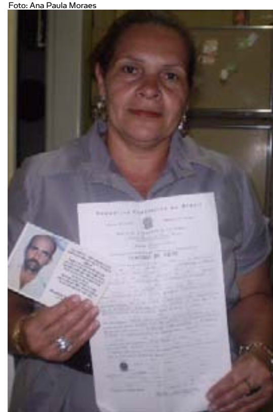
Reinaci perdeu o irmão em um acidente de carro e foi vítima de um aliciador do DPVAT

Devido à alta demanda, muitas vezes não é possível haver uma apuração mais detalhada dos casos. Uma situação comum é quando aliciadores ou próprios familiares de uma pessoa que teve morte natural se apropriam do corpo e o colocam em uma esquina ou rodovia para forjar um atropelamento e obter um benefício ilegal. Segundo o presidente do SIN-COR/DF, também há casos em que pessoas se apropriam de um atestado de óbito falso, carimbos e formulários do IML. “Isso é muito comum, principalmente em regiões pequenas”, finaliza.