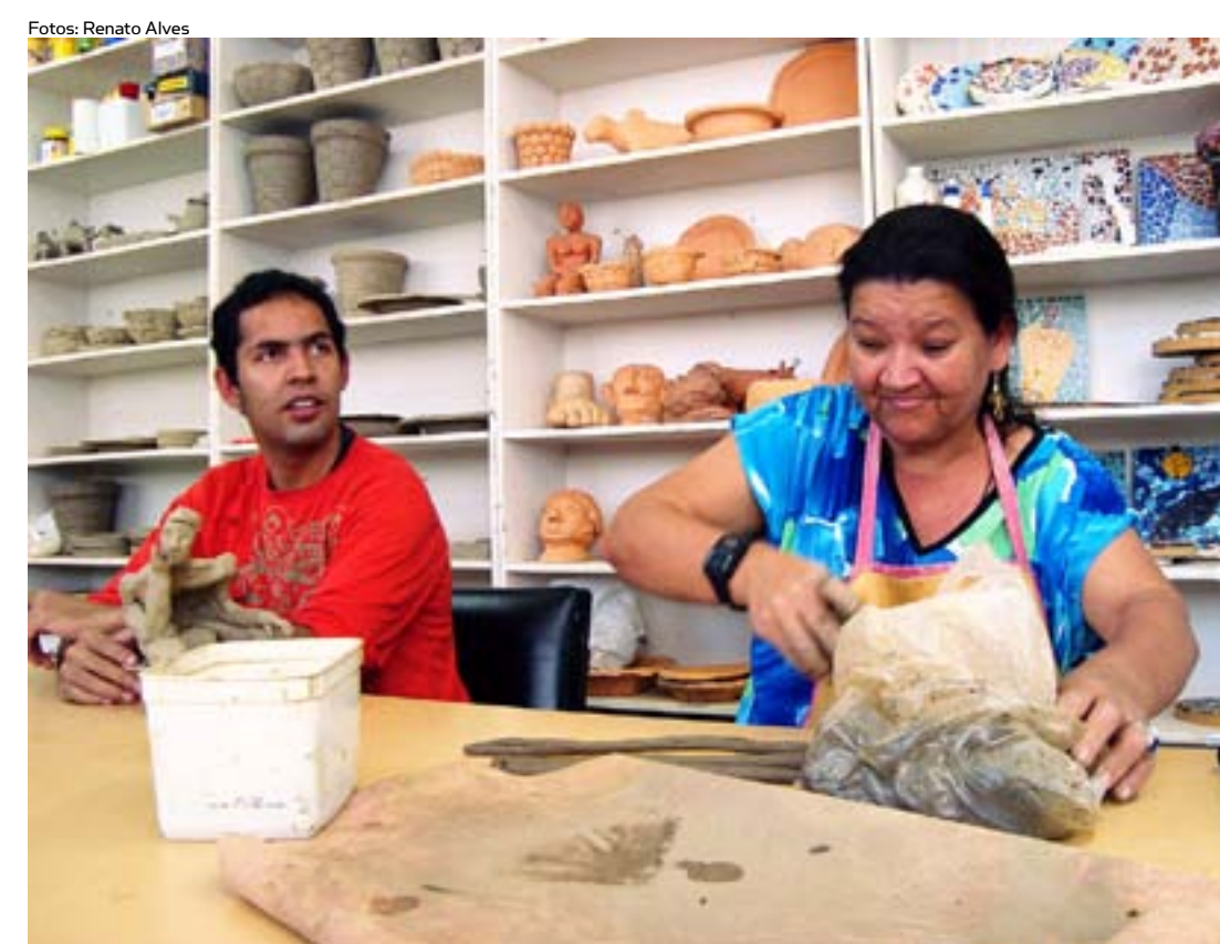
No Centro de Ensino Especial, os alunos realizam atividades manuais regularmente