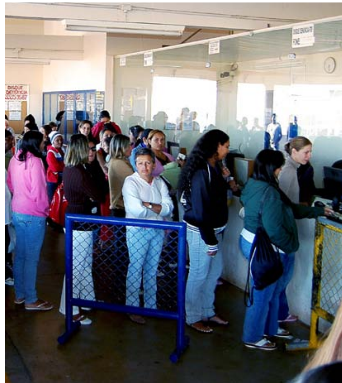
Depois do sacrifício, o grande momento é a hora de receber a senha para rever seus parentes