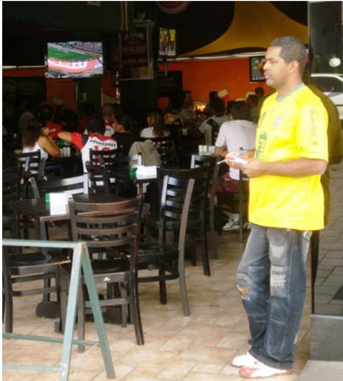
Funcionário de bar distribui comandas de consumação mínima no Plano Piloto