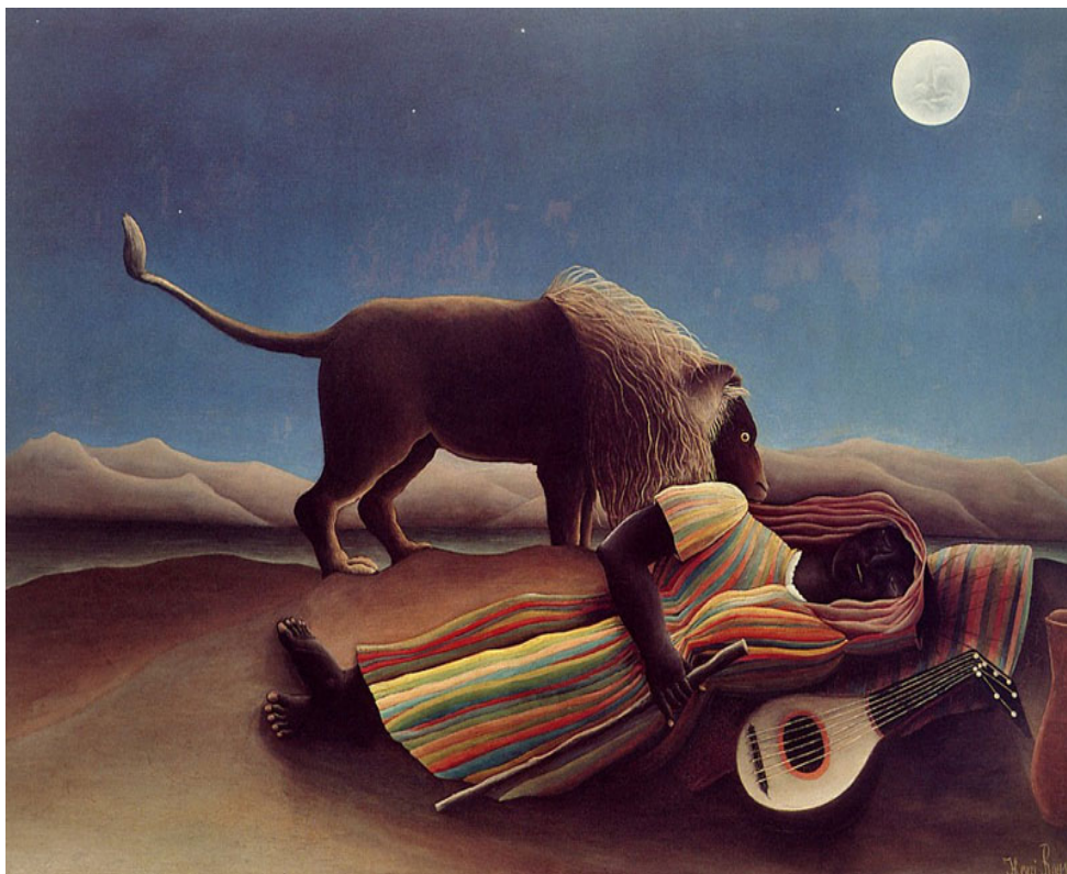
A cigana adormecida (Henry Rousseau) Nova Iorque, Museu de Arte Moderna, 1897

“As poéticas de Carlos Drummond de Andrade e Munch apresentam uma profunda identidade, sobretudo quando buscam traduzir as inquietações do ser diante da vida, da morte e diante de um mundo caótico constituído por sociedades injustas e repressoras, que contribuem, antes de tudo, para ampliar o sentimento do medo”. [FRANÇA, p. 156]