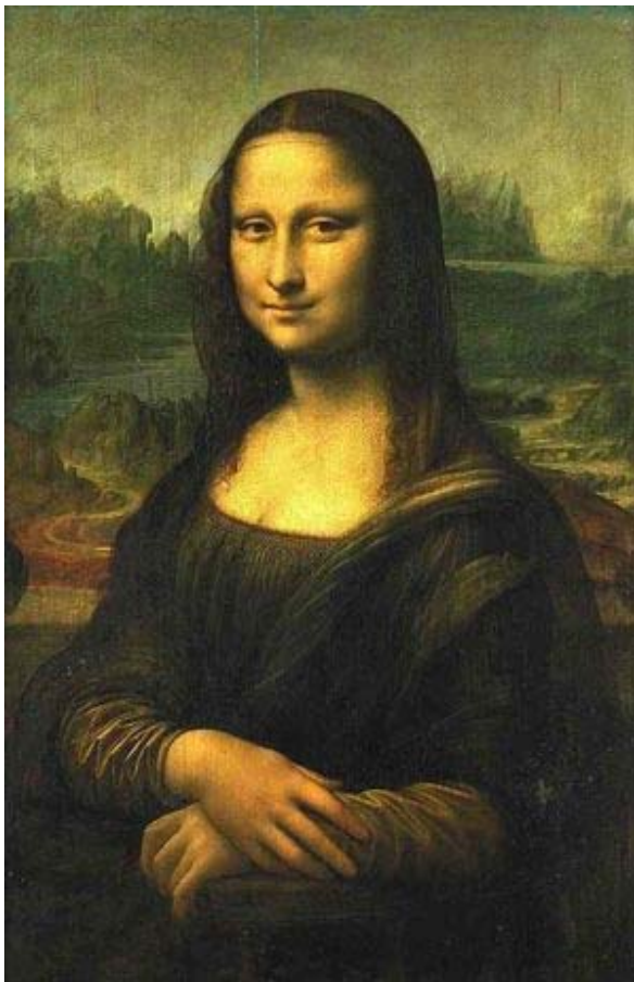
Retrato de Lisa Del Giocondo (Leonardo da Vinci) Paris, Museu do Louvre, 1503-1506

Devido aos planos da pintura, a imagem reproduz-se até o “sem-fim”: a cena do casal (primeiro plano), o espelho reflete a cena anterior e ultrapassa os limites da representação (segundo), juntamente com o espectador, o casamento dos Arnolfini é eternizado (terceiro).