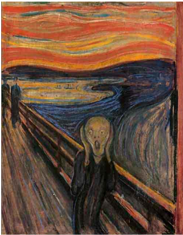
O Grito (Edvard Munch) Noruega, Galeria Nacional de Oslo, 1893