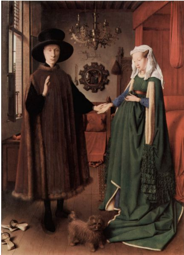
O casal Arnolfini (Jan Van Eick) Londres, National Gallery, 1434

Retrato do Casal Arnolfini (Jan Van Eick)